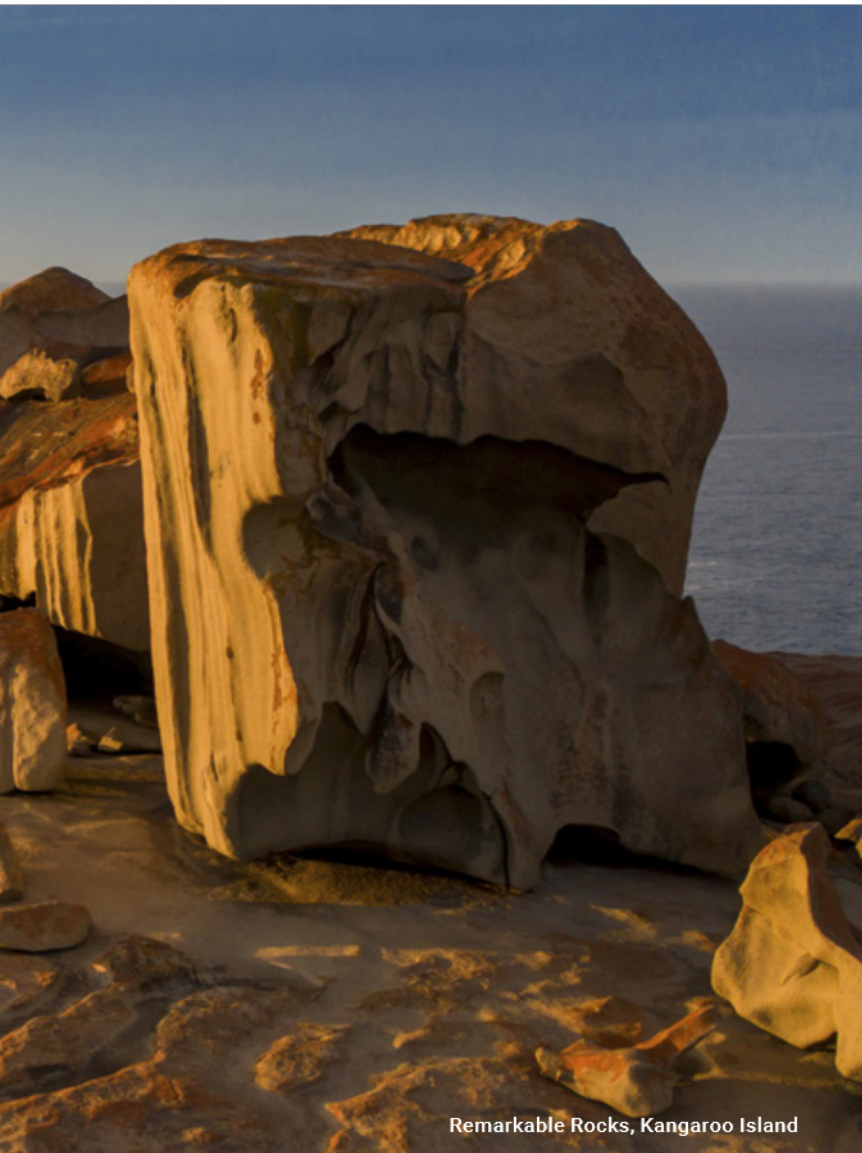
Remarkable Rocks, Kangaroo Island

Die erforderlichen Inlandsflüge sind nicht im Reisepreis enthalten, können jedoch optional dazu gebucht (siehe Preisliste S. 75) oder in Verbindung mit Ihrem internationalen Flug über Ihr Reisebüro erworben werden.