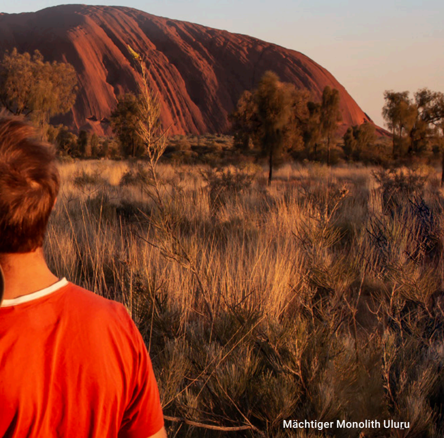
Mächtiger Monolith Uluru

Die erforderlichen Inlandsflüge sind nicht im Reisepreis enthalten, können jedoch optional dazu gebucht (siehe Preisliste S. 68) oder in Verbindung mit Ihrem internationalen Flug über Ihr Reisebüro erworben werden.