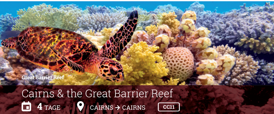
Great Barrier Reef